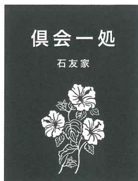
⑪ K ハイビスカス