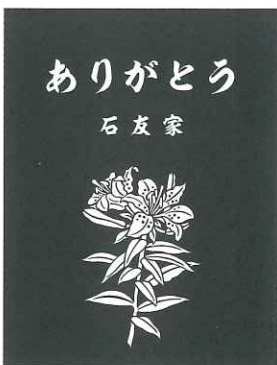
⑨ I カサブランカ