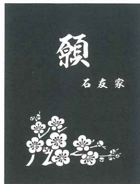
② B 梅