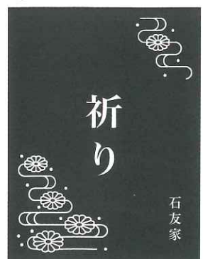
⑫ L 菊

オリジナルの彫刻をご希望の場合は、別途5万円(税込)で承ります。ご相談ください。