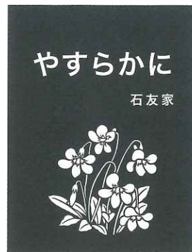
③ C パンジー