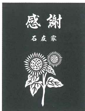
⑩ J ひまわり