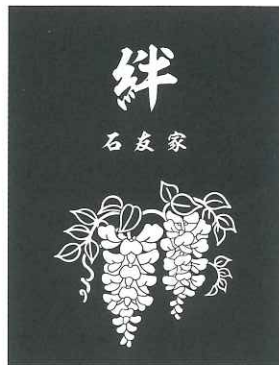
⑥ F 藤