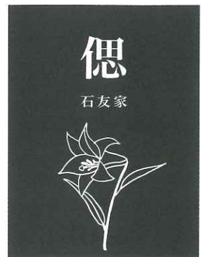
⑧ H ユリ