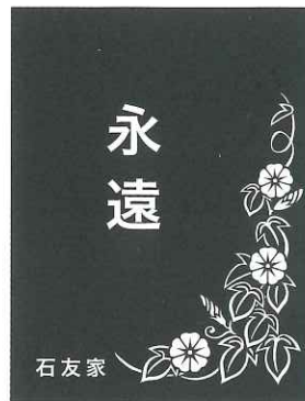
⑦ G アサガオ