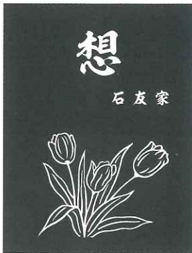
⑤ E チューリップ