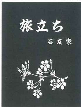
① A 桜