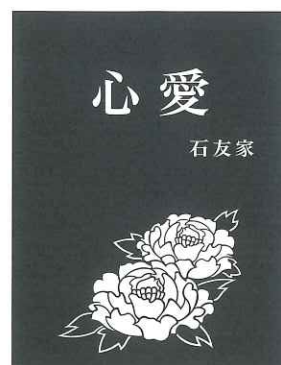
④ D ボタン