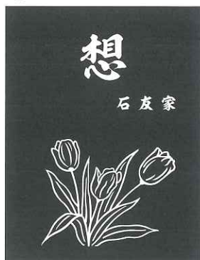
⑤ E チューリップ