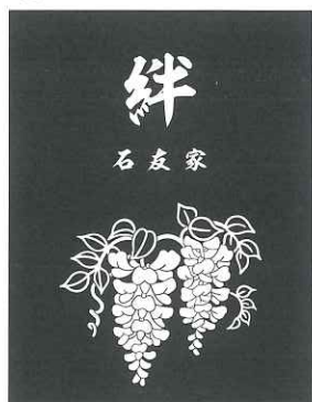
⑥ F 藤