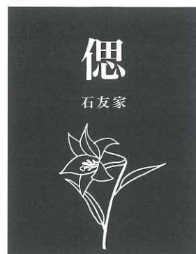
⑧ H ユリ