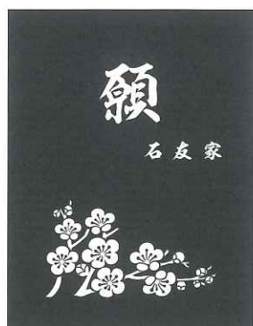
② B 梅