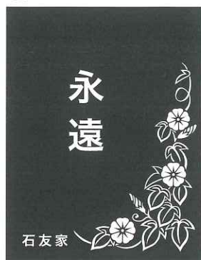
⑦ G アサガオ